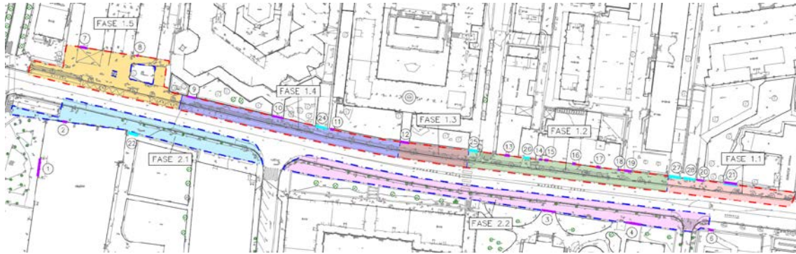
Foto 1. Fases de obra

Se prevé ejecutar los trabajos descritos en dos fases principales, divididas a su vez en diferentes subfases, tal y como se puede apreciar en la siguiente imagen.